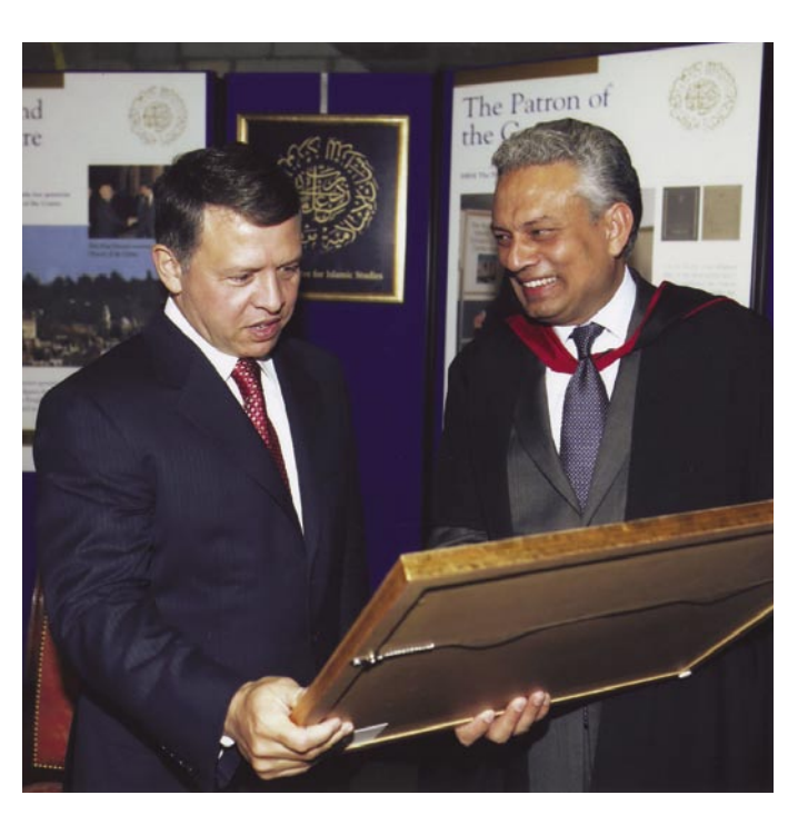
جلالة الملك عبد الله ومدير المركز

للمبنى الجديد مدير المركز وكبار أعضائه، واللورد اللفتانت لمنطقة أوكسفورد والشخصيات البارزة من مدينة أوكسفورد والمنطقة.