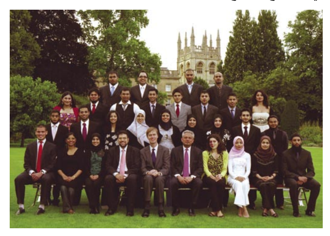
لمستر ستيفين تمس عضو البرلمان (السادس من اليمين) مع المدير والمشاركين في برنامج القيادة الناشئة الإسلامية

تم عقد المدرسة الصيفية السنوية الثالثة لبرنامج القيادة الناشئة الإسلامية في كلية كرائيست جرج في شهر يوليو، إن هذا البرنامج الذي ينسق بالتشارك بين المركز وصناديق الأمير الخيرية يتولى رعاية مدرسة صيفية سكنية لمدة أسبوعين للرجال والنساء من الناشئة المسلمة البريطانية ممن تظاهروا بقوة قيادية في مجالات اهتمامهم، والهدف من إقامة هذا البرنامج هو تشجيع المشاركين ليدرسوا معًا الطرق المختلفة التي يمكنهم أن يمارسوها في المجتمع الأوسع.