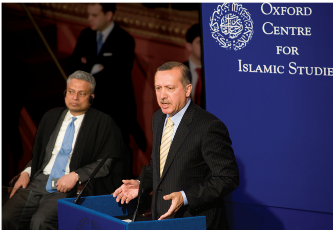
معالي السيد طيب أردوغان في مسرح شيلدونيان

وفي الختام قام بتقديم كلمة الشكر السير تيموثي داونت كى سي ايم جي رئيس الجمعية الإنكليزية التركية. ثم تفضل الوزراء بالحضور كضيف شرف على حفل العشاء الذي نظمه مدير المركز في كلية إكسيتير.