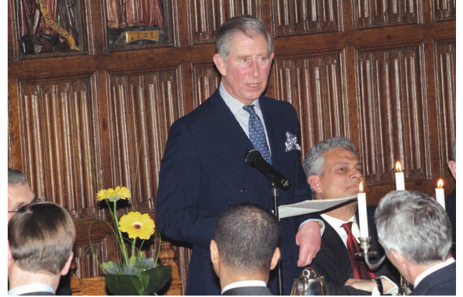
صاحب السمو الملكي الأمير تشارلز يلقي محاضرة قبل العشاء

وأهمية مشاركة أكبر من قبل الناشئين المسلمين البريطانيين في الحياة العامة، والحاجة إلى تطوير التطبيقات البيئية الفعالة الصالحة في البلدان الإسلامية، كما تحدث سمو الأمير عن عمله مع المركز منذ أن تولى رعاية المركز في 1993م العام الذي ألقى فيه كذلك خطابه الذي تم تداوله على نطاق واسع عن "الإسلام والغرب" والذي أكد فيه سموه على الحاجة إلى تفاهم أفضل بين العالمين الإسلامي والغربي، فقد قام المركز باتخاذ مبادرات عديدة لتطوير مثل هذا التفاهم، وقد تناولت مؤتمرات ديتشلي بارك السنوية مخاطبة القضايا والتحديات المعاصرة التي تواجه العالم، واستقطب برنامج القيادة الإسلامية الناشئة عبر أربع سنوات ماضية زعماء المستقبل وصانعي القرار من الجاليات الإسلامية في بريطانيا لتنمية مساهمة أكبر في الحياة الوطنية. شكر مدير المركز سمو الأمير على دعمه المتواصل والسخي وقيادته لمنبر الحوار الحضاري الذي دوى صوته على الصعيد العالمي، وتفضل بحضور حفل العشاء الأعلام الدوليون البارزون، وأعضاء البرلمان، ورؤساء كليات أكسفورد، والممثلون من منظمات المجتمع المدني الوطني.