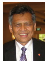
معالي الدكتور سورين بيتسوان

قام معالي الأمين العام لجمعية الشعوب الآسيوية الجنوبية (آسيان) الدكتور سورين بيتسوان بزيارة المركز خلال الفصل الجامعي الثاني، وتمت المناقشات حول تأثيرات الأزمات الاقتصادية العالمية في المنطقة ولتأثير الذي ستحملة الإدارة الأمريكية الجديدة في العلاقات الأمريكية والبريطانية نحو آسيان، كما تحدث عن المحاولات التي بذلت في