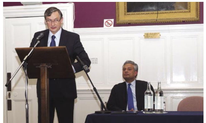
الرئيس دانييلو ترك

المختلفة للأقليات في أوروبا. لا حظ في محاضراته أن أوروبا ككل لها خبرة قليلة بالنزوح الجماعي، وكل بلد منها يحمل تجارب خاصة بالمهاجرين من البلدان المختلفة، ولا زالت هنالك حاجة إلى حوار حرّ ومفتوح حول تأثير هذه الهجرات على المجموعات السكانية ذات الأغلبية مع تقدير حاجيات المجموعات الأقلية. صرح الدكتور ترك أن العناصر المهمة لسياسات الهجرة يجب أن تركز على تشجيع الأقليات لخوض مجال العمل التجاري الحر، وتيسير طرق التعليم في جميع مستوياته لتأمين الفرص العادلة، واحترام حاجيات الجالية الإسلامية الدينية، واتخاذ التدابير لسياسة قوية ضد التمييز في ساحات العمل. وفي الختام دعا الرئيس إلى حوار أكثر تسامحاً وشمولاً بين الجاليات الإسلامية وغير الإسلامية في أوروبا، وأخير نظم مدير المركز حفل عشاء تكريماً للرئيس.