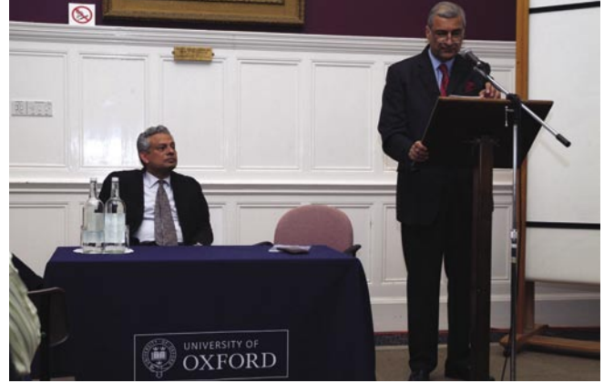
معالي السيد كامليش شرما

أكد الأمين العام على الدور الفريد الذي يمكن أن تلعبه الكومنولث في تشجيع مثل هذه المبادرات الإيجابية، ومن خلال التعامل على أساس تطوعي فإن الدول الأعضاء تتوخى تشجيع فهم أفضل التقاليد والعادات المختلفة والثقافات المتنوعة التي تصوغ مجموعة الكومنولث، إن هذا التعامل يتطلب الحوار المستمر، والاحترام المتبادل، ومحاولة واعية لإدراك ما يهم الآخرين بغض البصر عن الجنسيات والثقافات والتقاليد المختلفة.