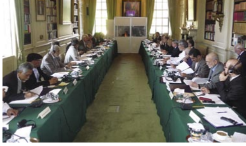
المشاركون في مؤتمر ديتشلي

قام المركز تلبية لطلب من راعيه الفخري صاحب السمو الملكي الأمير تشارلز بتنظيم مؤتمر حول الإسلام والبيئة، تم عقده في ديتشلي بارك في 17-19 أكتوبر 2008م، وحضره الزعماء الدينيون، وعلماء الطبيعة، والباحثون، وخبراء البيئة، وصناع القرار من عدد كبير من البلدان (الولايات المتحدة الأمريكية، والمملكة المتحدة، والمملكة العربية السعودية، والكويت، وقطر، وعمان، والعراق، ومصر، والهند، وبنغلاديش، وماليزيا، وإندونيسيا) وممثلون من المنظمات الدولية بما فيها الأمم المتحدة والبنك الدولي.