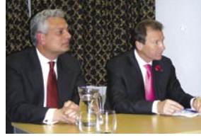
السير او دونيل

سيتدهور من سيئ إلى أسوأ، ثم وفر تفاصيل عن معالجة الحكومة البريطانية لهذا الوضع المؤلم، كما قام السيد او دونيل بدراسة معطيات الأقليات تجاه قطاعي العمل والتجارة في بريطانيا، ولاحظ الإنجازات المهمة التي حققها المسلمون كمقاولين ورجال أعمال وتجارة.