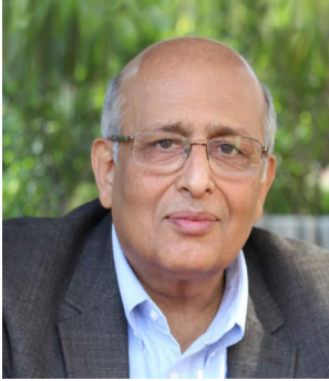
السير ديفيد كلاري

البروفيسور السير ديفيد كلاري، الرئيس السابق لكلية مجدلين بجامعة أوكسفورد، في منصب المستشار الأول لهذا المشروع على زمالة الملك سلمان في المركز، والدكتور شاهد جميل، مدير كلية تريفندي للعلوم البيولوجية بجامعة أشوكا واختصاصي الفيروسات الرائد في الهند، على منصب الباحث الرئيسي للمشروع.