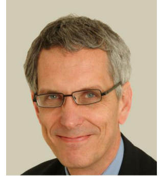
السير ديفيد كلاري

وتّمّ تعيين اثنين من الخبراء البارزين على مناصب رئيسية لتنفيذ هذا المشروع: عُيّن