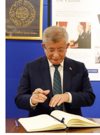
معالي الأستاذ أحمد داود أوغلو

استضاف المركز معالي الأستاذ أحمد داود أوغلو، رئيس وزراء تركيا الأسبق، لإلقاء محاضرة بعنوان «العالم الإسلامي اليوم». وتناولت المحاضرة، في عرض واسع النطاق، الخصائص المميزة للحضارة الإسلامية في سياقها التاريخي العالمي، منذ بداياتها الأولى وحتى العصر الحاضر. وأكد الأستاذ داود أوغلو أهمية القيادة الأخلاقية والفكرية القوية بوصفها سبيلاً لتجاوز مظاهر التشتت وتعزيز آفاق التعاون والوحدة.