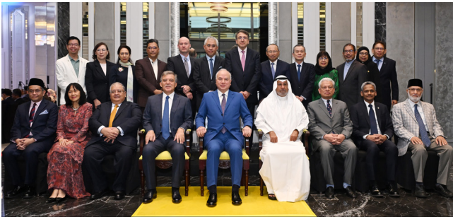
المشاركون في المائدة المستديرة السادسة عشرة في كوالالمبور

ويتناول اهتمام د. توماس البحثي قضايا التمويل الإسلامي من زوايا الفقه والقانون والسياسات العامة، وقد قاد عدداً من المشاريع البحثية التي دعمت تطوير الأطر التنظيمية في الولايات المتحدة والمملكة المتحدة وغرب أفريقيا ومنطقة الخليج. ومن أحدث مؤلفاته كتاب "التمويل الإسلامي والتنمية المستدامة" الصادر عن دار روتليدج.