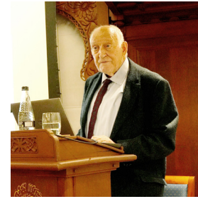
الأستاذ روبرت هيلنبراند

وأثبتت المحاضرة أنه قد تمّ خلال القرن الرابع عشر تشييد عدد لا فت من الأضرحة في مدينة قم ومحيطها، وهي مركز مهمّ للزيارات الشيعية. واستنادًا إلى طيف واسع من الشواهد الوثائقية، قدّم الأستاذ هيلنبراند تحليلًا مفصلاً للسّمات المعمارية