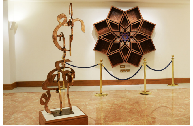
منحوتة أمين غلجي في المركز