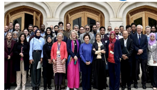
المشاركون في مؤتمر المناخ والصحة والإيمان في المركز

وناقش المتحدثون الكيفية التي تسهم بها المواقف والتصورات الاجتماعية في تحديد أنماط تبني الابتكارات التكنولوجية، وفي قياس مدى نجاحها وتأثيرها في المجتمعات.