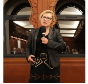
الدكتورة جيليان تيت

ألقى الدكتور جيليان تيت، عميدة كلية الملك بجامعة كامبريدج، محاضرة كيث غريفين للعام الراهن، استندت في عرضها إلى خلفيتها في علم الأثر وولوجيا وخبرتها في مجالي الصحافة والاقتصاد لتسلط الضوء على عمق وتوسع إعادة الذكاء الاصطناعي تشكيل فهمنا لماهية المجتمعات البشرية.