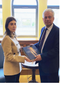
صاحبة الجلالة الملكة راجازاريت صوفيا

قامت السيدة غايانه عمروفا بزيارة المركز للاطلاع على مجالات عمله وبرامجه الأكاديمية، وبحث سبل التعاون المستقبلي. وتشغل السيدة عمروفا منصب رئيسة قسم الاقتصاد الإبداعي والسياحة في إدارة رئيس جمهورية أوزبكستان، كما ترأس مؤسسة تطوير