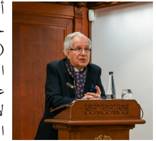
الأستاذ محسن جاسم الموسوي

استضاف المركز محاضرة جائزة الملك فيصل التي ألقاها الأستاذ محسن جاسم الموسوي (جامعة كولومبيا)، الفائز بالجائزة في عام ٢٠٢٢ تقديرًا لإسهاماته في الأدب العربي.