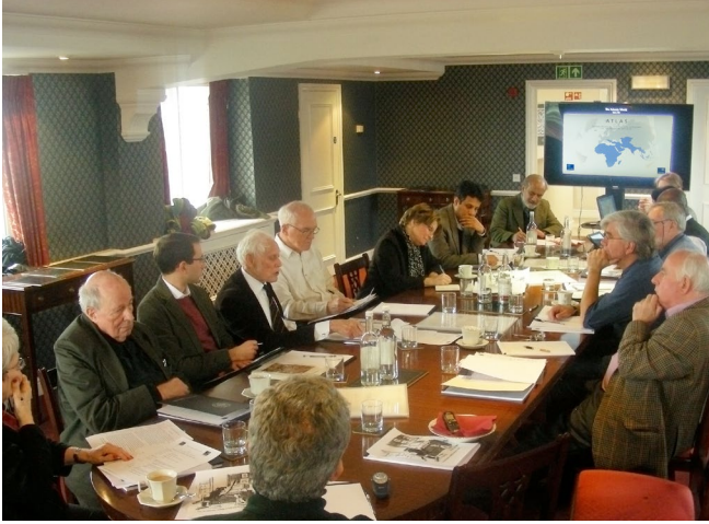
المشاركون في مؤتمر الأطلس المنعقد في مارس

نظم المركز خلال الأشهر الماضية عدة مؤتمرات أكاديمية، بعضها مع شركاء دوليين، تعزيراً لما التزمه من البحث في مجال تاريخ الإسلام الاجتماعي والفكري في جنوب آسيا ووجود المسلمين في أوروبا. وفي هذا الصدد، استضاف المركز في مارس مؤتمراً بأوكسفورد للنظر في توسيع نطاق مشروع الأطلس - المشروع البحثي الرائد الذي يدرس انتشار الشبكات الاجتماعية والفكرية في العالم الإسلامي عبر الزمان والمكان - في المستقبل ليشمل مناطق غير جنوب آسيا.