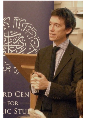
السيد روري ستورت، عضو البرلمان، أثناء ندوة خاصة في قاعة الإحسانات

والأخرى ترأسها السيد شيرارد كاوبر-كولس، السفير البريطاني إلى أفغانستان سابقاً والممثل الخاص عن المملكة المتحدة لأفغانستان وباكستان لاحقاً، والذي قد كتب عن الفترة التي قضاها في كابل.